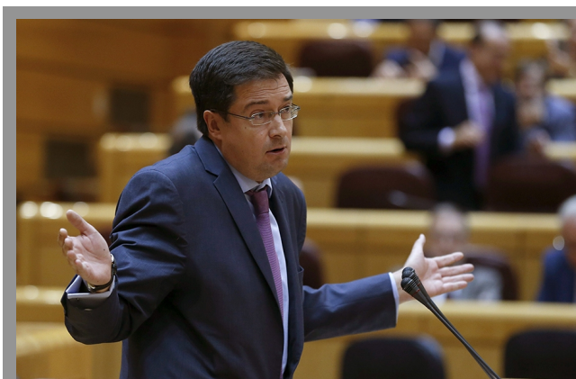
El senador socialista y vicepresidente primero de la Comisión, Óscar López

de ley para modificar de nuevo la Ley y recuperar el modelo de consenso que creó el Gobierno de Zapatero para la designación del presidente de RTVE. El senador socialista y vicepresidente primero de la Comisión, Óscar